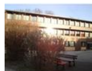
« EUROJEANNE » LYCEE GENERAL et TECHNOLOGIQUE